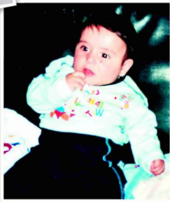
אילאי בתמונות ילדות לפני שמצבו הידרדה.

יכולים לעזור לו. הרגשנו שאנחנו קורסים לתוהם".