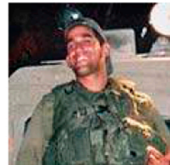
ליעד גולן ז"ל